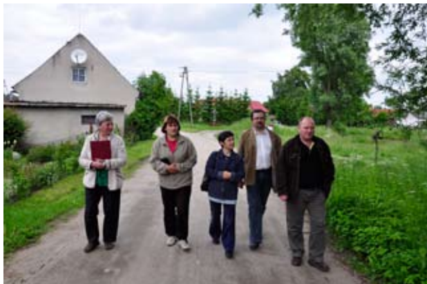
Komisja lustracyjna z wizytą w Godkach

Turnieju Sołectw, prezentacji kramów jarmarcznych podczas turnieju oraz oceny wykonanych prac. Wszystkie miejscowości,