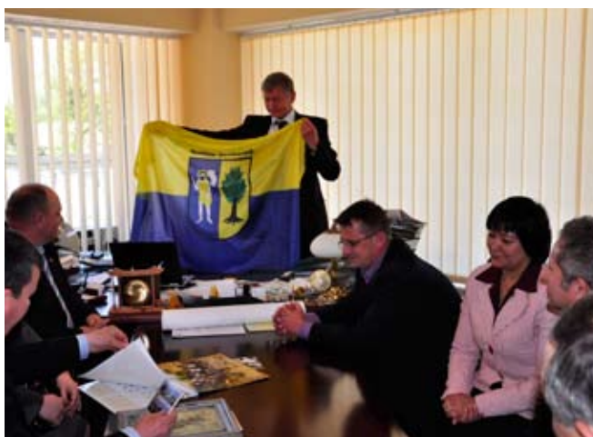
Spotkanie z władzami Guriewska

Następna wizyta w Kaliningradzie zaplanowana jest na koniec października. Latem będziemy gościć uczniów z Obwodu. Zgodnie z ustaleniami do spotkania dojdzie na polach Grunwaldu podczas inscenizacji bitwy - 18 lipca.