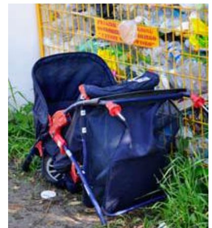
Segregacja odpadów według niektórych mieszkańców

W niniejszym numerze biuletynu umieszczono specjalną wkładkę z informacją o poprawnej segregacji odpadów.