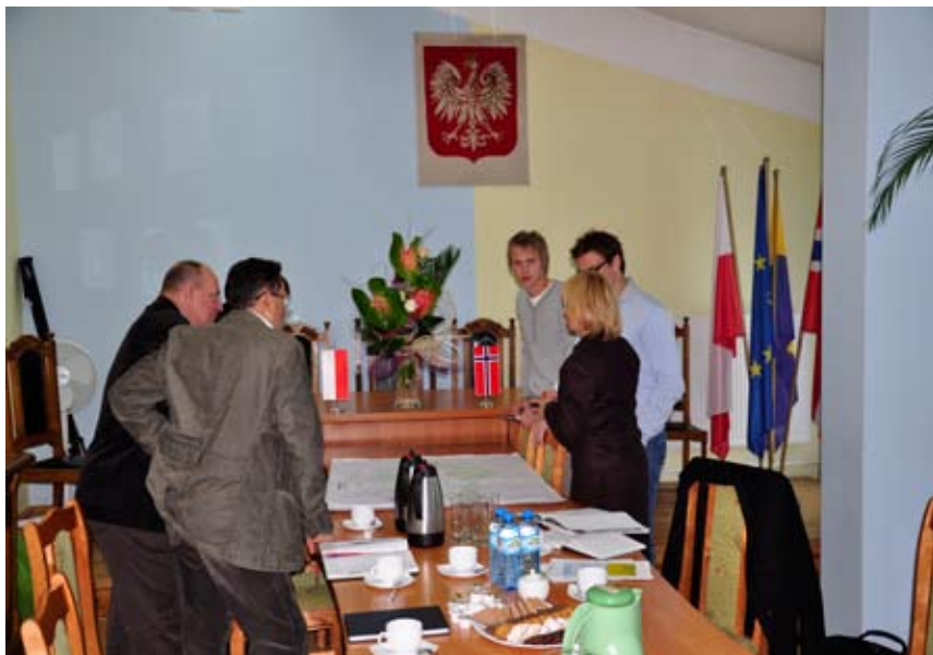
Spotkanie w Urzędzie Gminy z delegacją firmy Septik24

ności stanowi źródło bezzwrotnej pomocy zagranicznej.